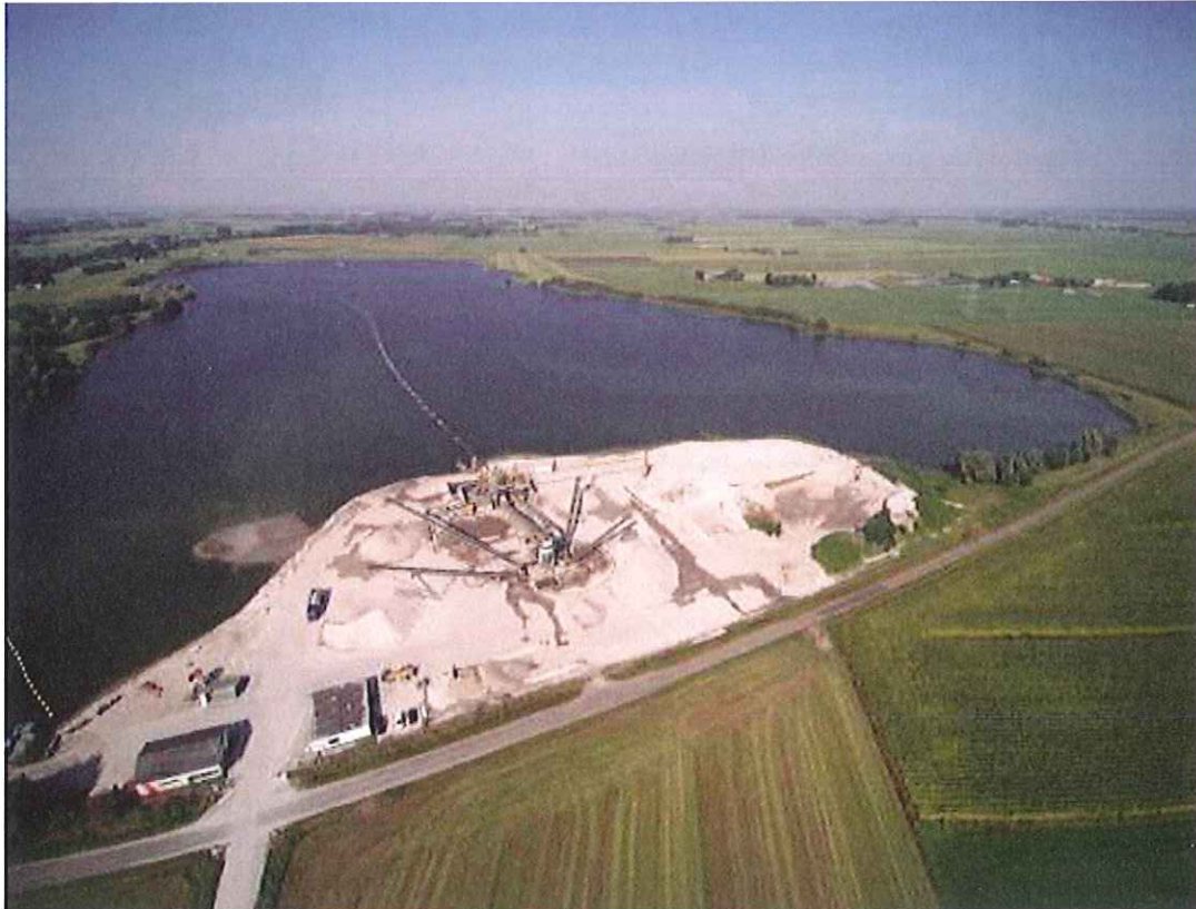
Afbeelding 1: Luchtfoto zandwinningslocatie

Het plangebied ligt in het buitengebied ten noordoosten van Zwolle, dat bekend staat als 'Haerst - Genne'. Aan de noordzijde wordt het plan globaal begrensd door de Haersterbroekweg, aan de oostzijde door de Bomhofsweg, aan de zuidzijde door de Doornweg en aan de westzijde door de Dashorstweg. De omgeving wordt gekenmerkt door een voornamelijk agrarisch landschap met verspreide landelijke woonbebouwing en agrarische bedrijven. Het gebied ligt buiten de bebouwde kom.